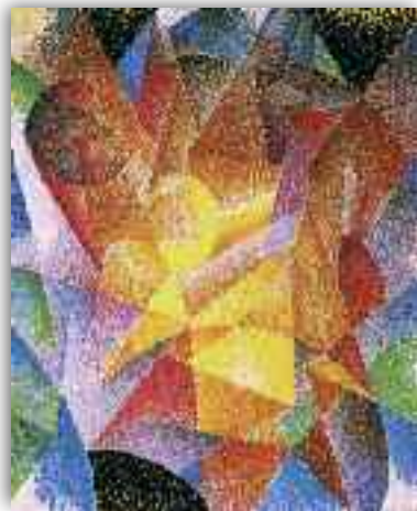
In copertina Gino Severini Espansione sferica della luce (1913-1914)

Qualora il Ministro del Lavoro approvasse la nostra riforma, l'autonomia dell'Enpam sarebbe comunque in discussione a ogni bilancio tecnico triennale se il testo del comma 24 dell'articolo 24 del decreto Salva Italia non dovesse essere corretto o formalmente interpretato. Aspettiamo fiduciosi il via libera del Governo, ma teniamoci pronti all'azione sindacale.